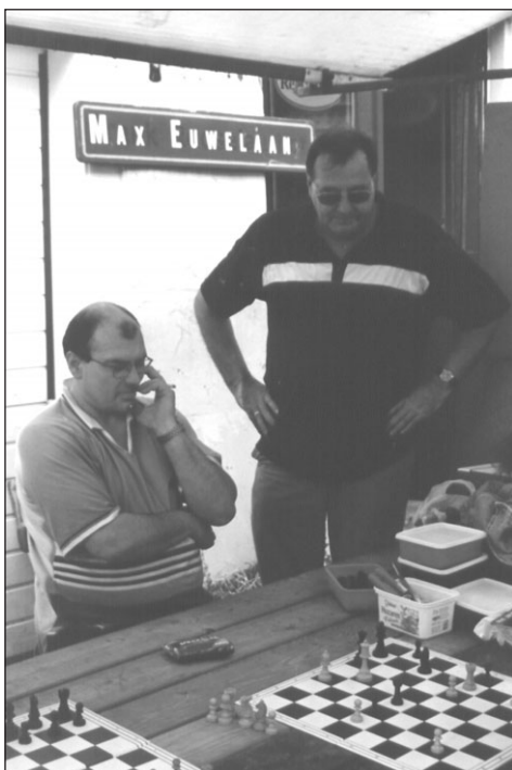
Promotie tijdens de Moordrechtse braderie op de Dorpsstraat, voor deze gelegenheid omgedoopt tot Max Euwelaan.